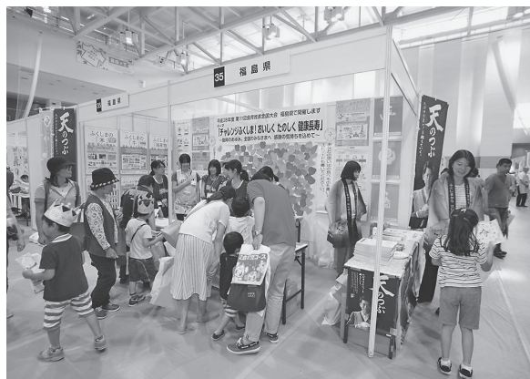
(昨年の全国大会の様子)

全国大会では、ビッグパレットふくしまを会場に、クッキングショーなどのステージイベントを実施するほか、屋内・屋外で合計120以上のブースを設置し、「第三次福島県食育推進計画」の3つの施策のもと、県内外からの来場者に、おいしく楽しく学んでもらえるように3つのイベント（体験型・参加型・試食型）で構成します。