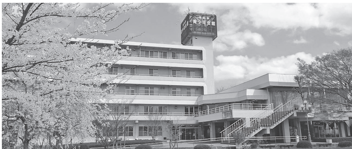
ふくしま結婚・子育て応援センター（福島県青少年会館）

今後とも、センターでは、企業・団体との連携を図りながら、結婚から子育てまで様々な事業を展開してまいりますので御理解と御協力をお願いいたします。