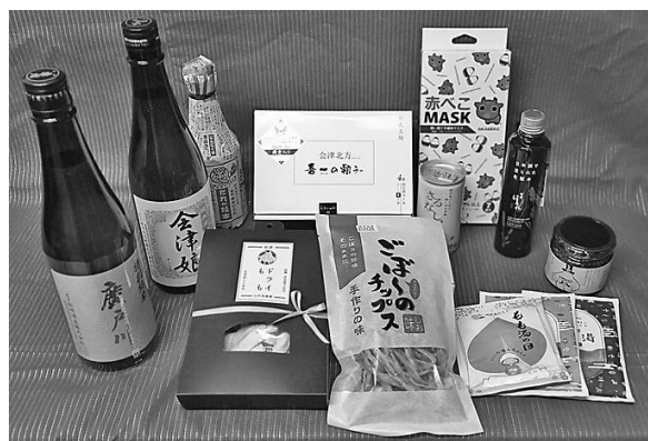
県産品詰め合わせセットの例