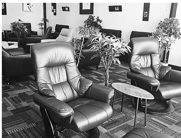
特典で無料利用できる「らうんじ f (エフ)」

ビジネスコーナーもあるので、Wi-Fi や電源コンセント、お茶、コーヒーなどのサービスを無料で利用しながら、さまざまなタイプの座り心地の良いソファで、優雅で快適なひとときを過ごすことができます。