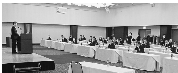
3月30日 福島経済同友会での講演