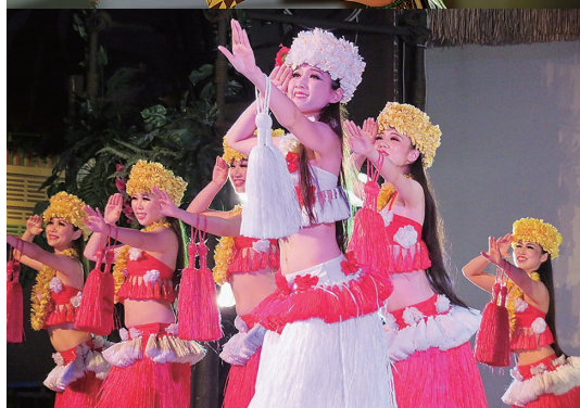
▲ポリネシアンショー