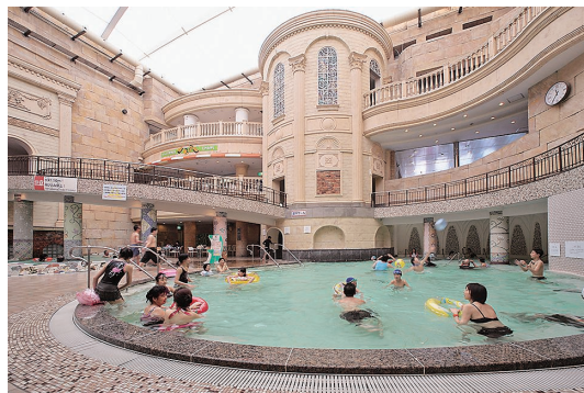
スプリングタウン▲

ワクワクプロジェクトでは、顧客の対応が素晴らしいと判断した従業員に管理職からアロハカードにコメントを書いて渡される。この枚数が一定数たまると、名札に色のついたプレート、通称「かまぼこ」がつく。その色は赤、青、そして金へと変わっていく。接遇の成果が見える化され、これも接客サービス品質向上に向けた従業員の学び合う環境づくりに貢献してきた。