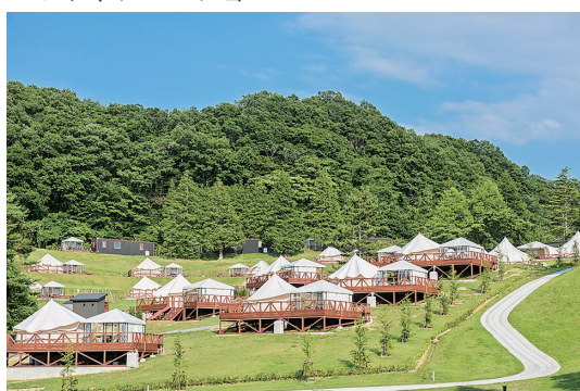
▲グランピング施設「マウナヴィレッジ」

他方、休業中、踊る場所を失ってしまったフラガールたちは、いわき市や福島県の復興のために、全国を回ってフラダンスを笑顔と元気とともに届けた。「フラガール全国きずなキャラバン」を展開する。その後もキャラバンは被災地などの慰問だけでなく、形を変えながら現在まで続けられている。ちなみに、コロナ禍でキャラバンの展開が難しい状況のときには、特別無料公演「フラガール全国きずなキャラバン2021」をライブ配信した。