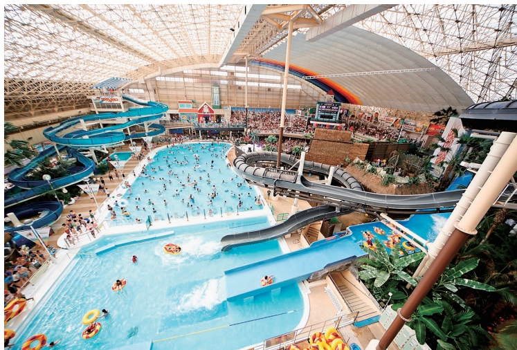
ウォーターパーク全景▲

江戸時代に発見され、明治以降の日本の経済発展に貢献してきた、いわき地方の石炭。そして、その中心であった「常磐炭礦」。昭和30年代に入り、石炭から石油へとエネルギー転換が起こると斜陽産業へと向かっていった。とりわけ、「常磐炭礦」は坑内から湧き出る大量の温泉に悩まされ、その処理にかかる費用の負担も大きかった。そのような先行きが見えない将来の中で炭鉱の閉山を迫られたのである。