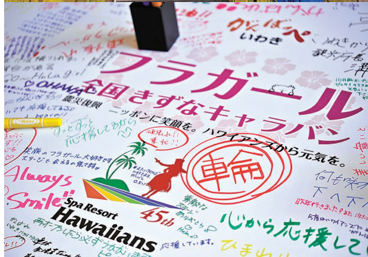
▲きずなキャラバン